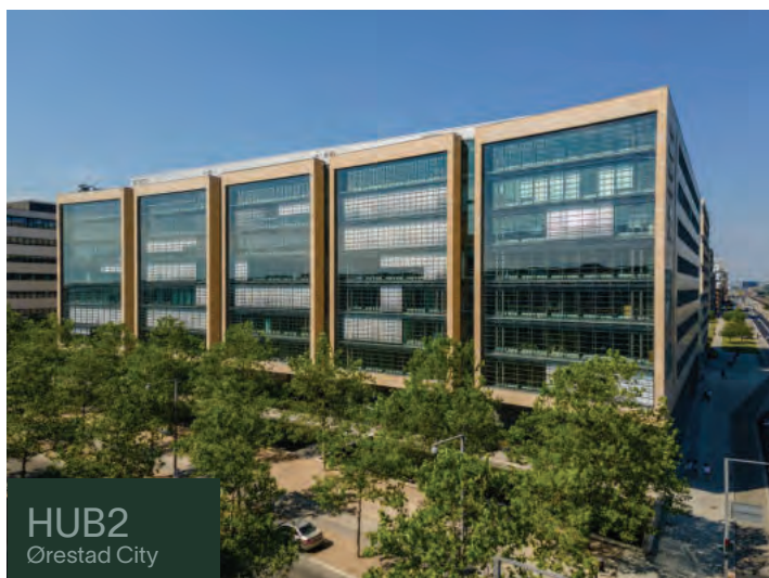
HUB2 Ørestad City