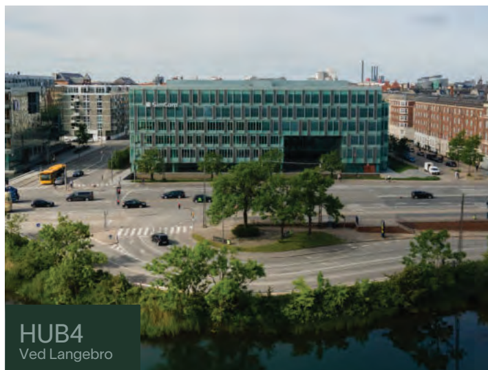
HUB4 Ved Langebro