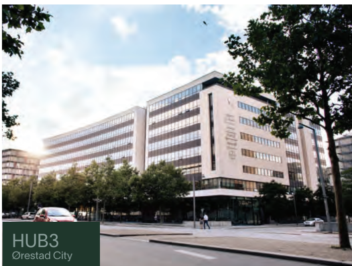
HUB3 Ørestad City