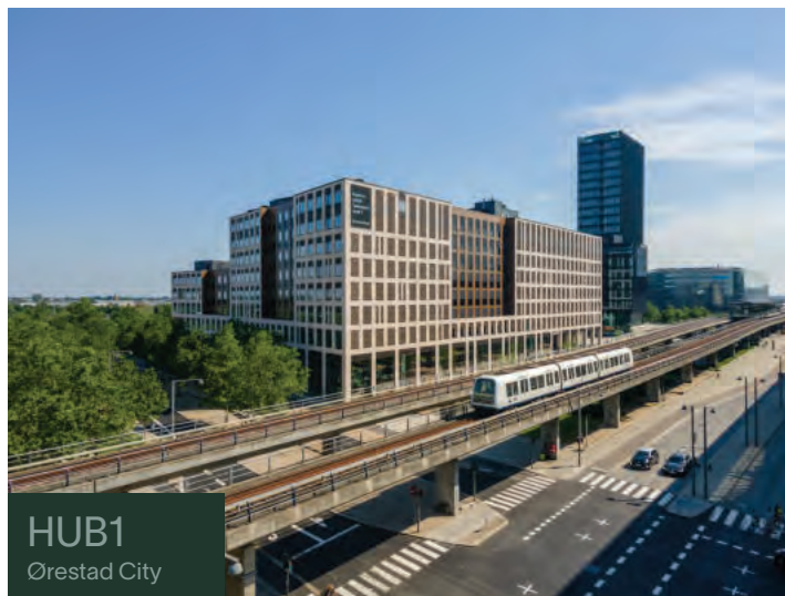
HUB1 Ørestad City